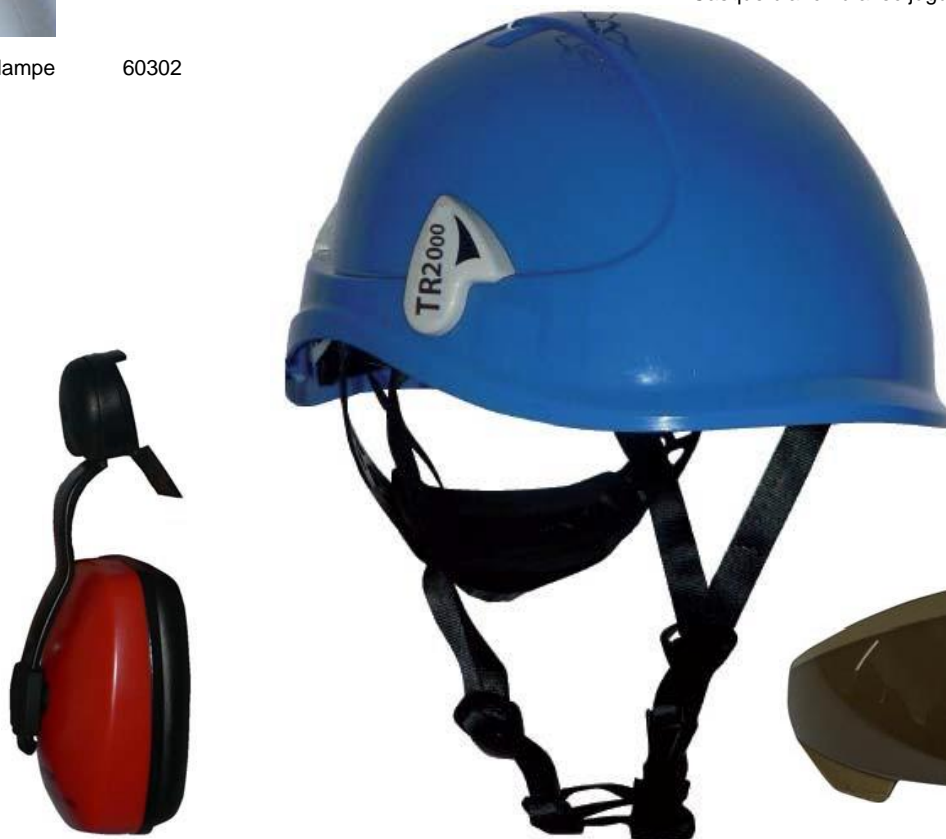
Casques coquille antibruit clipsable 60282

Casque bleu nu avec jugulaire 4 points 60252 Casque rouge nu avec jugulaire 4 points 60432 Casque blanc nu avec jugulaire 4 points 60442