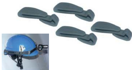
Clips porte lampe